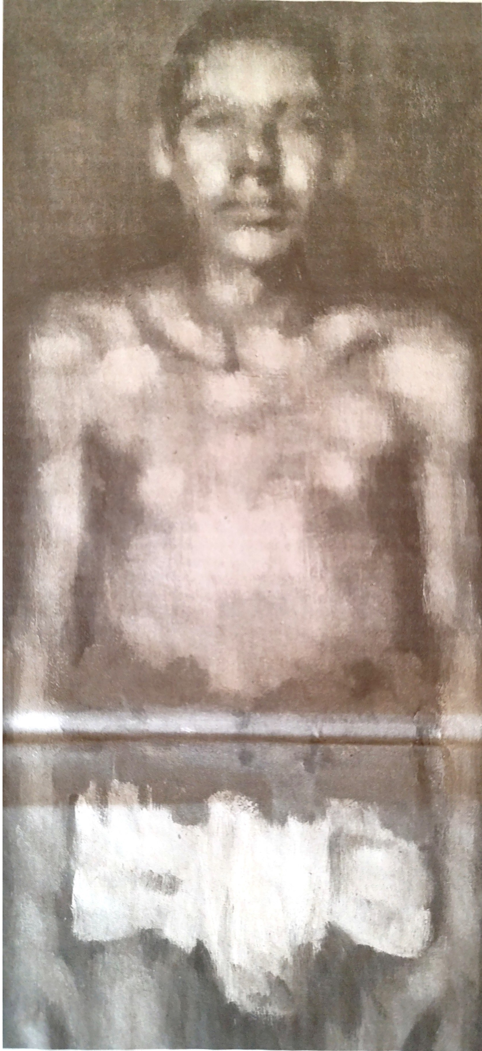
Bálint Norbert-László: Bátorság