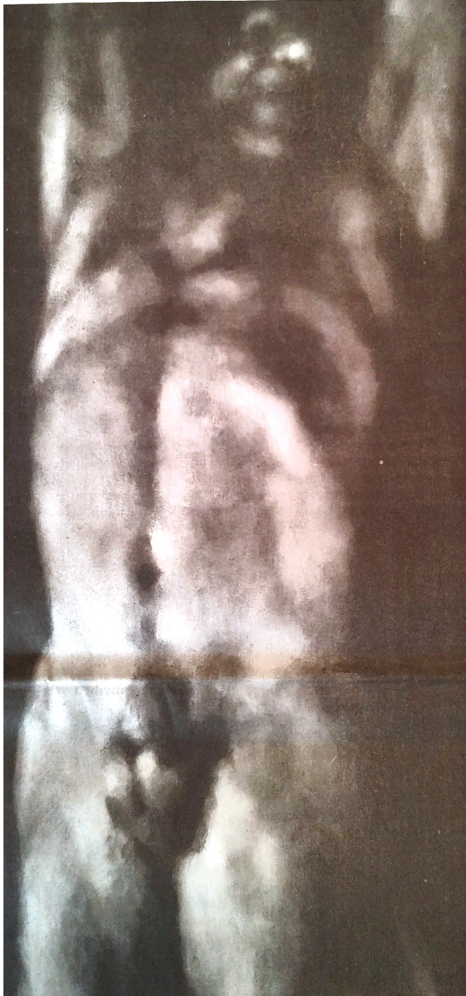
Bálint Norbert-László: Hasadás