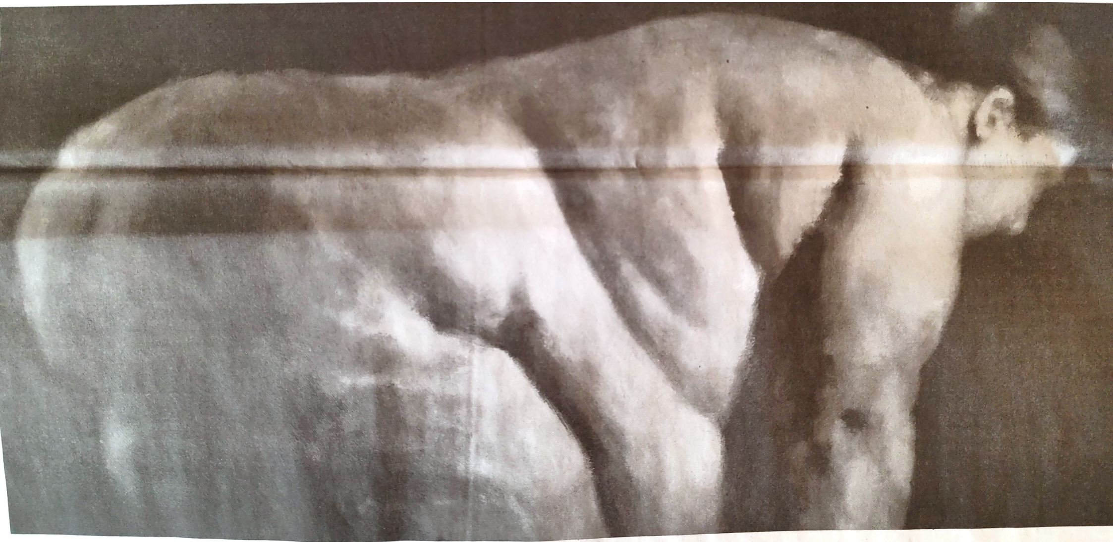
Bálint Norbert-László: Exploit II.